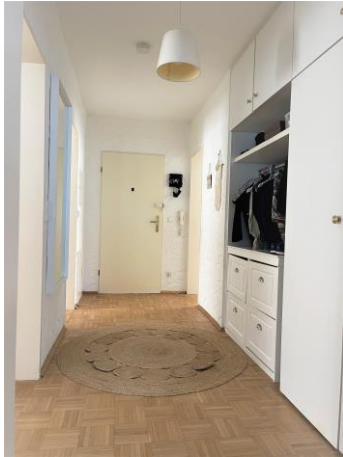
Die Wohnungsdiele mit praktischen Einbauschränken