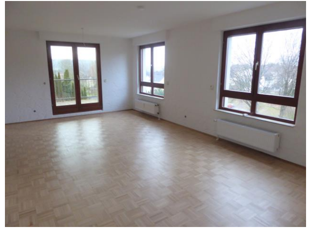
Das großzügige Wohn-/ Esszimmer mit Zugang zur Loggia