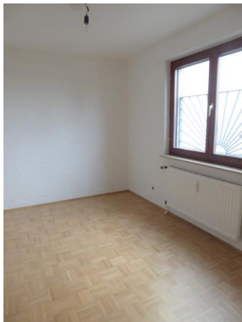
Das individuell nutzbare Kinder-/ Arbeitszimmer