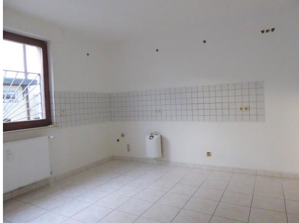
Die großzügige Wohnküche